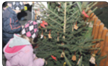
Advent připravuje Vánoce (str. 4)