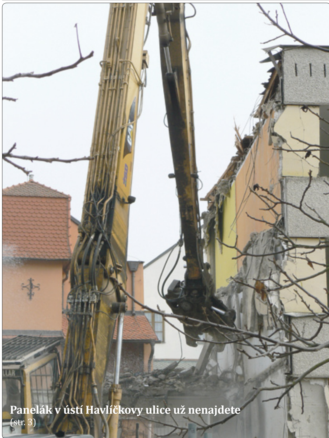
Panelák v ústí Havlíčkovy ulice už nenajdete (str. 3)