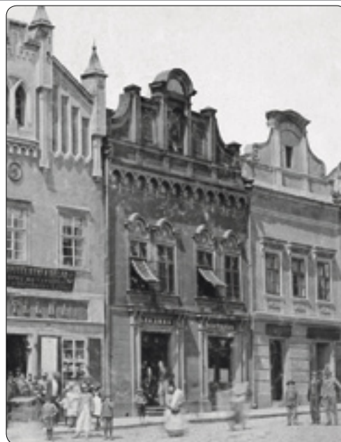
Lékárna U Zlaté koruny ještě na původním místě v čp. 18 (dnes dům galerie), r. 1893