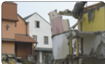
Historický okamžik v ČR (str. 3)