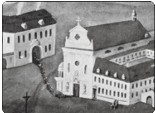
Pohled na klášter z r. 1744. Při jihozápadním rohu schodiště k lékárně.

Přesto však v té době již za horní městskou branou jedna lékárna existovala – ve vznikajícím klášteře augustiniánů. První zmínky o ní podávají klášterní anály v létech 1676 a 1684, postupně se v dokončované stavbě stěhovala z místa na místo, až se trvale usídlila v jedné z cel na jihozápadním rohu. Neměla sice právo veřejnosti, jednalo se o zařízení uzavřené sloužící pouze členům řádu, ale předpisy jsou jedna věc, a realita bývá někdy odlišná. Lze také připustit, že se augustiniáni snažili u veřejnosti napravit určitou nedobrou pověst, která předcházela jejich usazení v Brodě a počáteční nevoli magistrátu i děkanství se založením kláštera. Zcela jistě klášterní lékárna dobře prosperovala k spokojenosti obyvatel Brodu. Pro snadnější výdej medikamentů byly k jejímu oknu dokonce postaveny schody. Několik desítek let oběma stranám situace vyhovovala, zřejmě tedy nebylo ani další veřejné světské lékárny ve městě třeba. Řádoví bratři také koncem první poloviny století rozšířili klášterní zahradu o bývalou chmelnici u cesty ke kostelu sv. Trojice, aby zde mohli