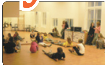
Rubešovka plná života (str. 8-9)