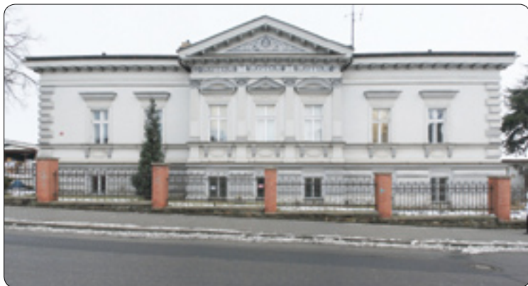
Dům č.p. 108