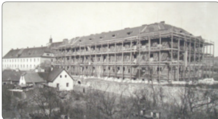
Budova školy gymnázia, dnes ZŠ Štáflova