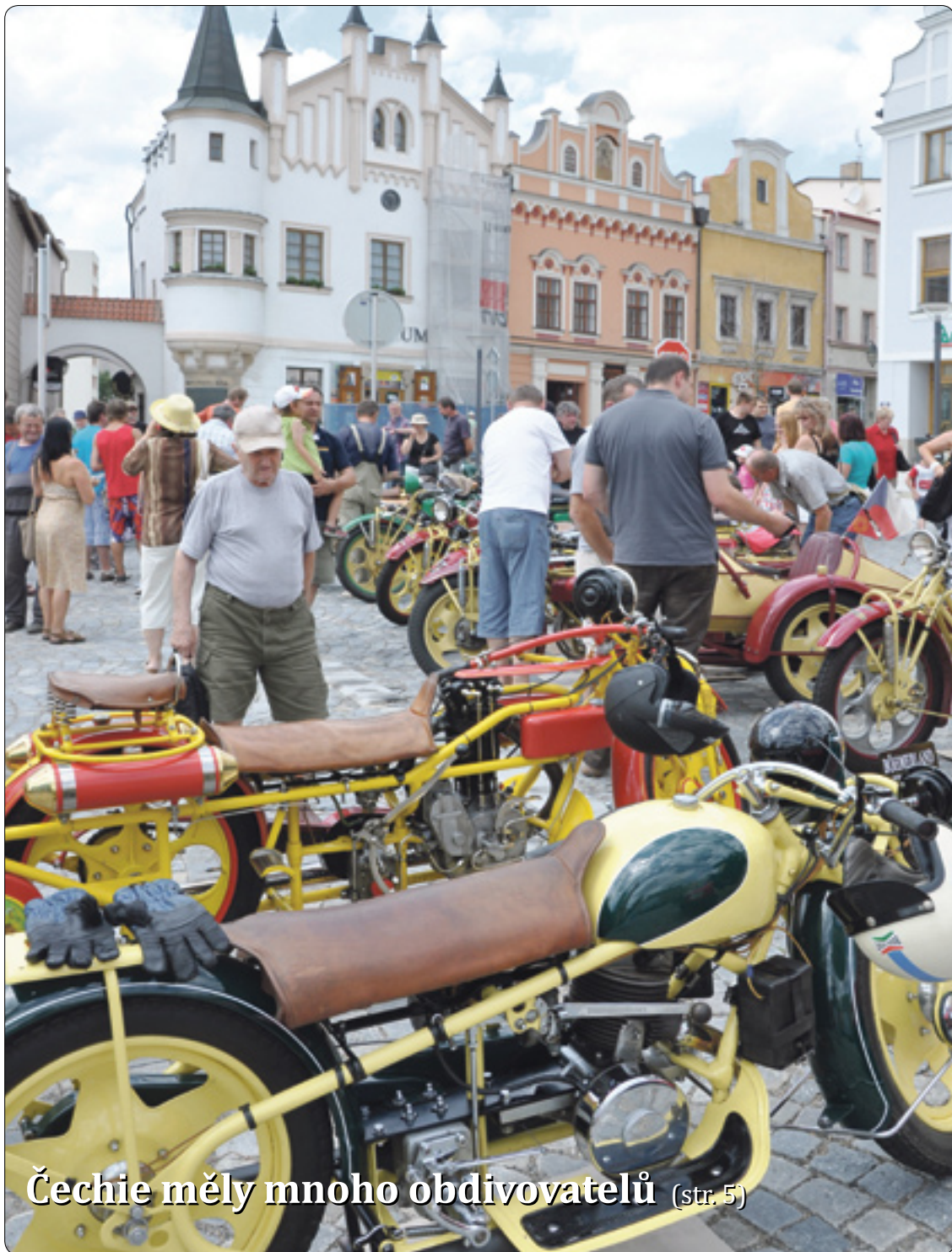
Čechie měly mnoho obdivovatelů (str. 5)