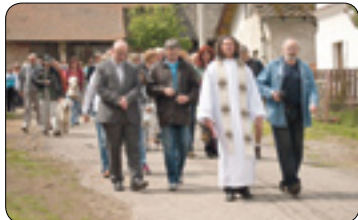
Oslava 700 let Mírovky (str. 5)