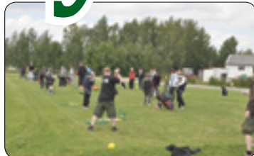
Golf na letišti (str. 5)