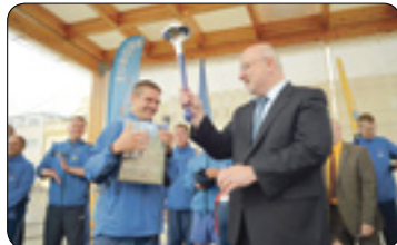
Světový běh harmonie (str. 4)