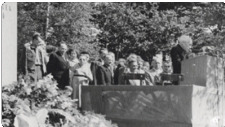
Zdeněk Nejedlý při projevu u Havlíčkova pomníku 29. 7. 1956