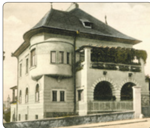
Dům č.p. 137 na pohlednici