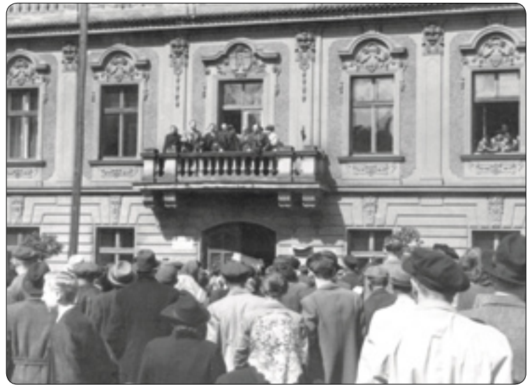
Přejmenování města dne 5. 5. 1945

Povstání v Havlíčkově Brodě bylo tak do večera potlačeno, což se ne-