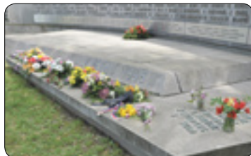
Pomník se rozrostl o jména dalších obětí (str. 4)