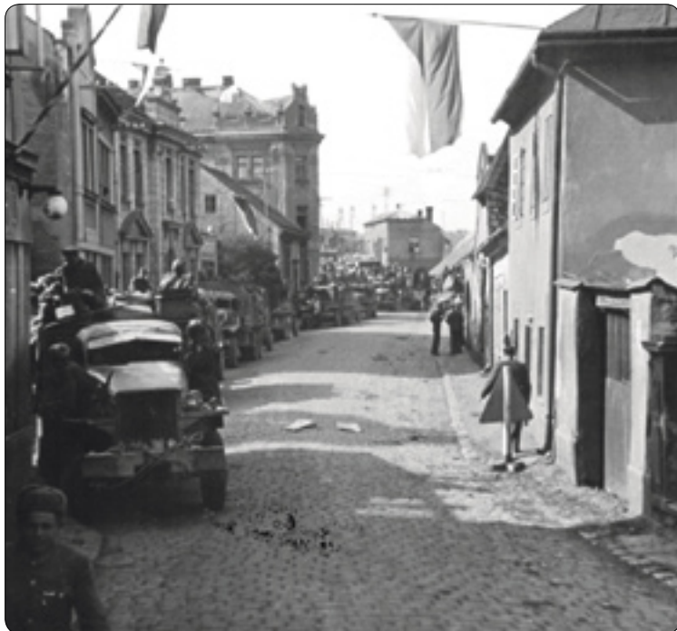
Sověti v jihlavské ulici

Michal Kamp Muzeum Vysočiny Havlíčkův Brod