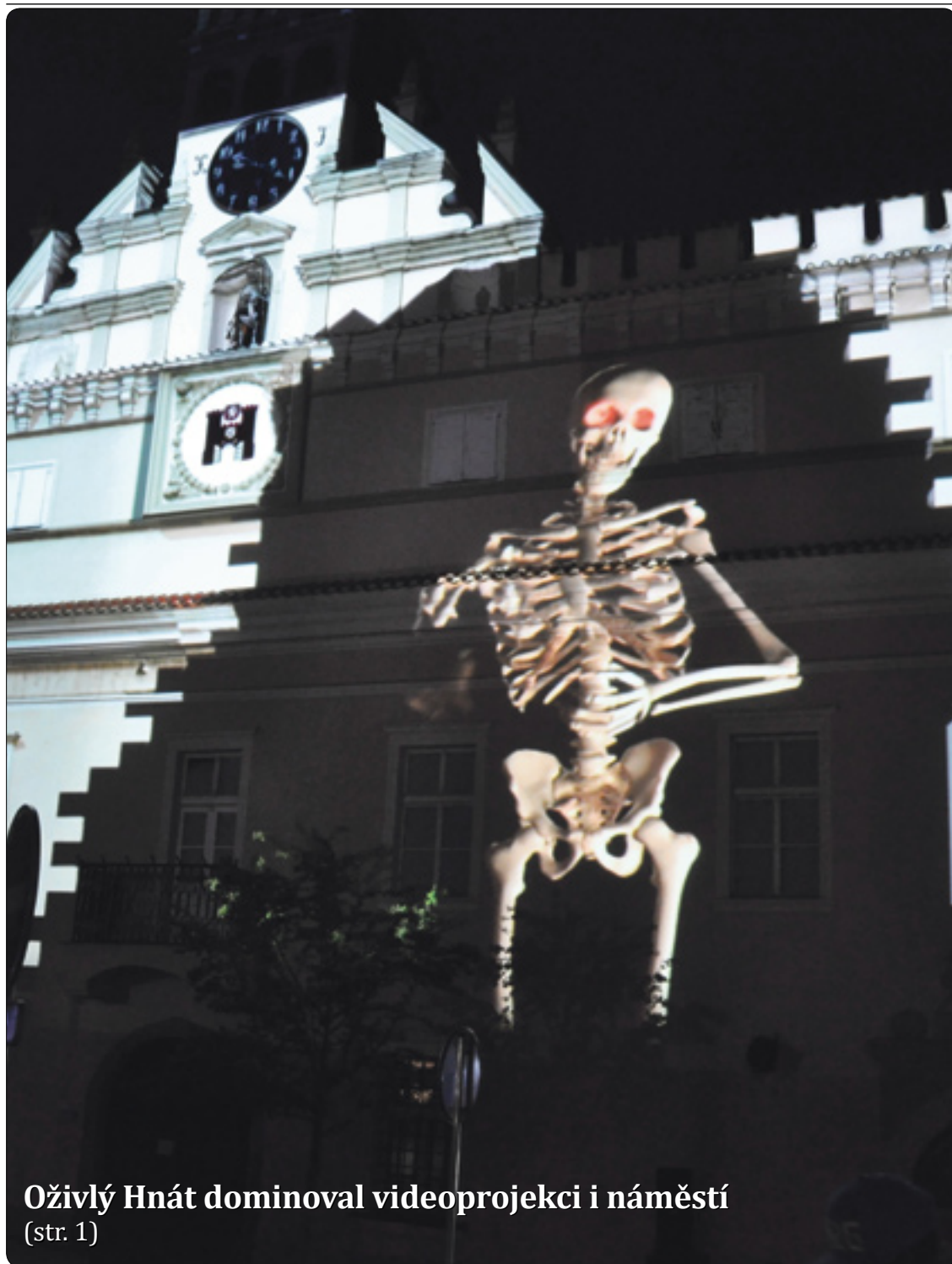
Oživlý Hnát dominoval videoprojekci i náměstí (str. 1)