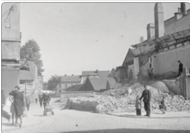
Poznáte z této fotografie křižovatku dvou ulic v Havlíčkově Brodě?

Ve spolupráci s havlíčkobrodským Muzeem Vysočiny jsme pro čtenáře Havlíčkobrodských listů připravili fotokvíz z různých částí našeho města. Úkolem je poznat místo, kde byla fotografie pořízena nebo objekt, který na snímku je. Je to pořádně těžké uhádnout, zvláště v některých případech, proto jsme pro vylosovaného autora správné odpovědi připravili zajímavou odměnu. Také tento kvíz je tedy soutěžní. Stačí fotografii vystřihnout, doplnit k ní odpověď a doručit do boxu Havlíčkobrodské listy na podatelně Městského úřadu na Havlíčkově náměstí. Nezapomeňte na sebe uvést adresu a telefon.