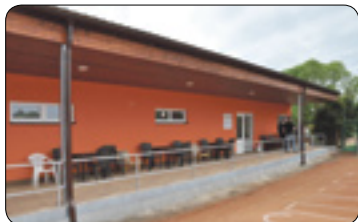
Nové zázemí tenisového oddílu TJ Jiskra (str. 3)