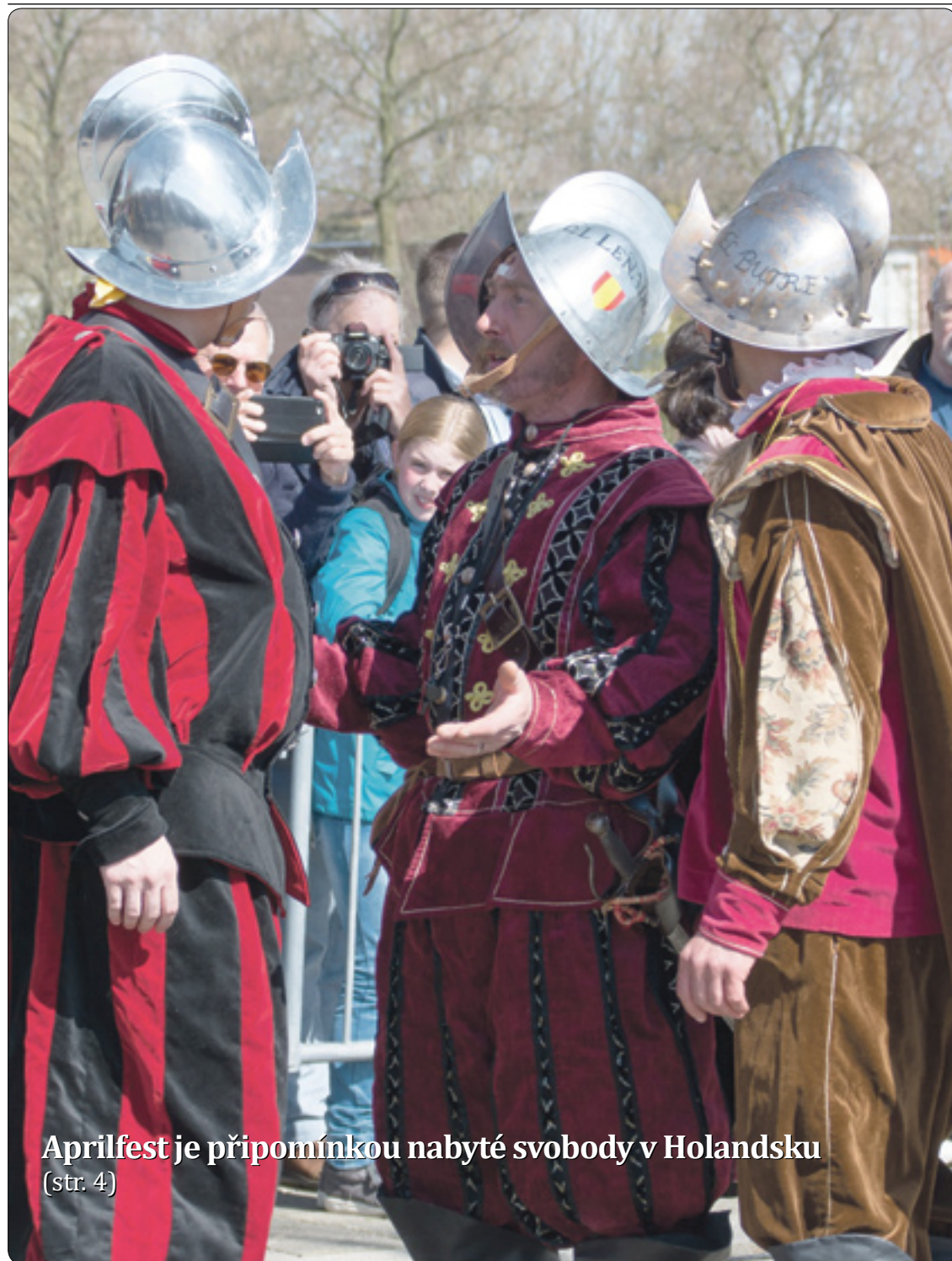
Aprilfest je připomínkou nabyté svobody v Holandsku (str. 4)