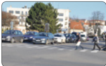
Uzavírka mostu přes Žabinec u hotelu Slunce (str. 12)