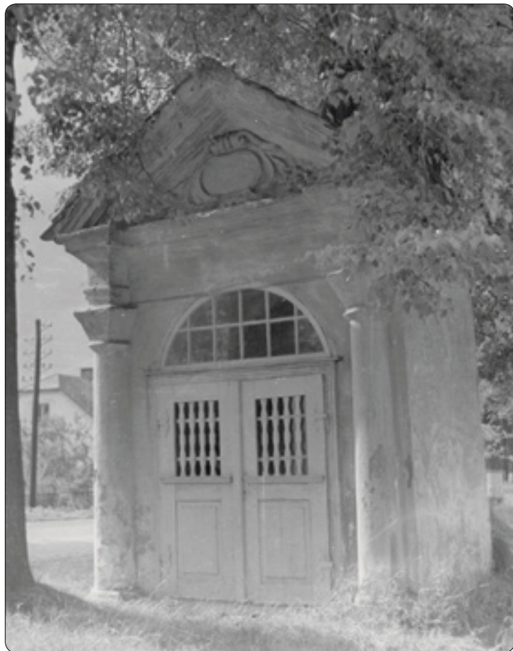
Poznáte ulici na fotografii? Z fotoarchivu Muzea Vysočiny Havlíčkův Brod p.o.