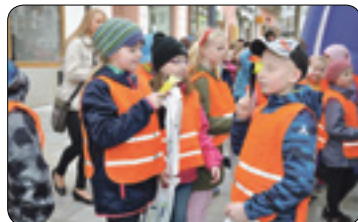
Bezpečná Vysočina – Dětská silniční kontrola (str. 4)