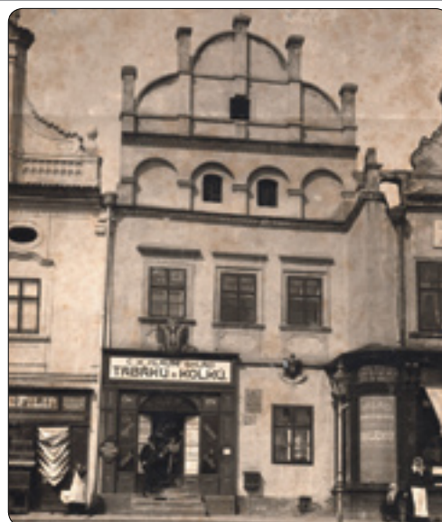
Dům čp. 179, v němž byl od r. 1855 sklad tabáku a trafika.

Menšíkovi již odebírali zboží z bližší státní tabákové továrny v Jihlavě, nedlouho předtím založené. Jihlavská tabačka nahradila v r. 1851 zrušený podnik v Klosterbrucku (nyní Louka) u Znojma a ve své době byla největším průmyslovým závodem ve městě. V provozu byla více než sto let, dnes je v části bývalé-