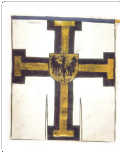
Korouhev velmistra Řádu z bitvy u Grunwaldu roku 1410

O brodskou farnost a několik far v okolí města se řádoví bratři – kněží (s plebánem v čele) starali od poloviny 13. století. Řádové sídlo – fara – stálo v místě současné farní budovy u kostela Nanebevzetí Panny Marie. Mělo patrně období obdélné patrové stavby připomínající obytnou věž a dodnes se z něj dochovalo několik skrytých detailů pod omítkami a velké sklepení. Dnešní farní zahrada až ke Štáflově baště patřila k hospodářství fary a pravděpodobně sama věž v nároží opevnění byla bratry v rámci komplexu užívána.