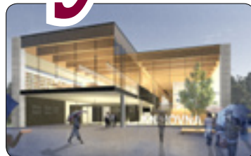
3. krok k výstavbě Krajské knihovny Vysočiny (str. 18)