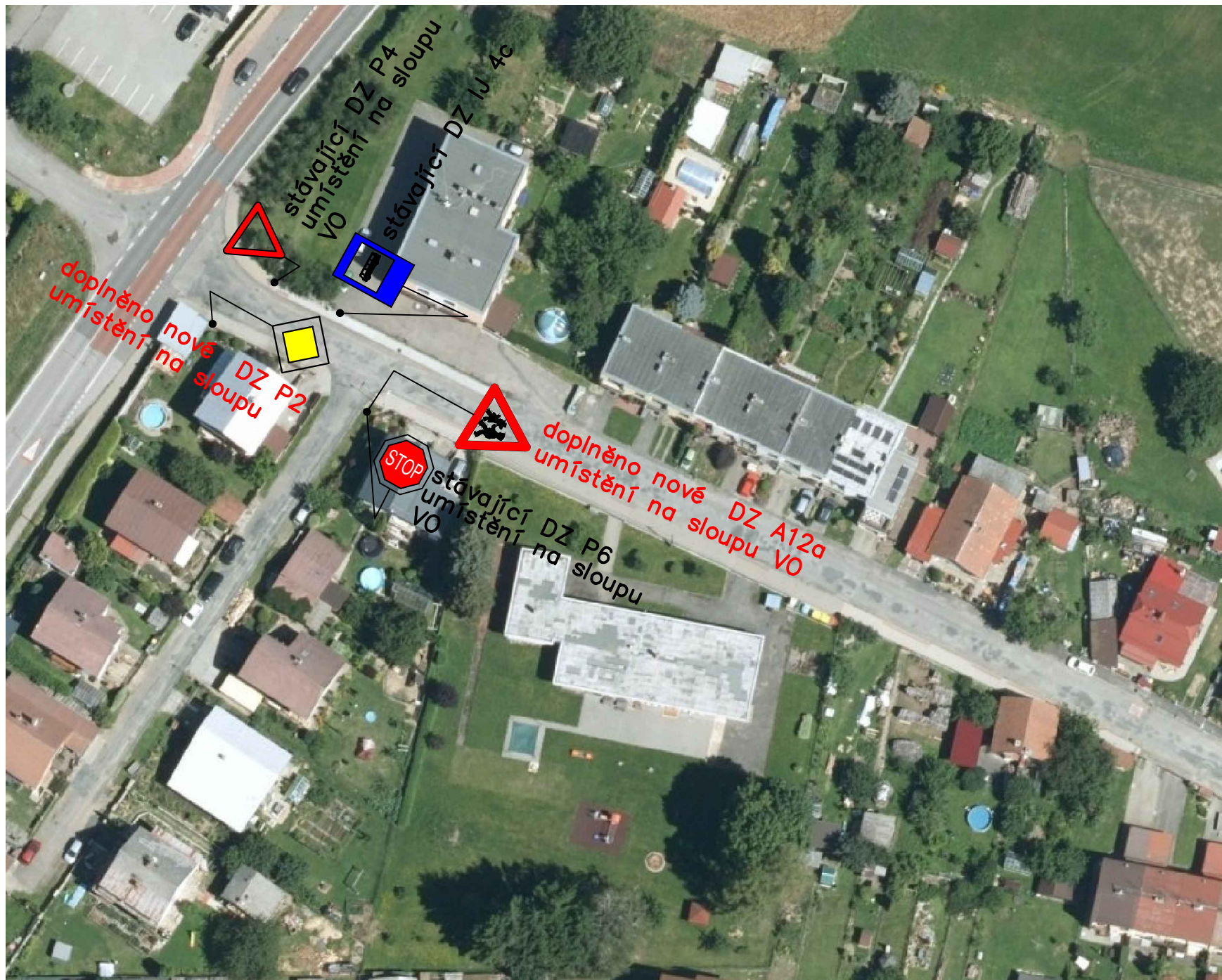
TABULKA NOVÉHO DZ