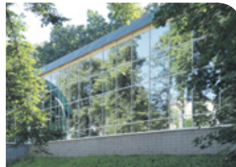
Nový plavecký bazén