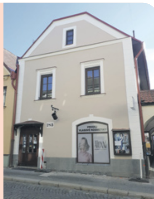
8/24 – Dům č.p. 183, Horní ulice, obnova fasády, Program regenerace MPZ 2023

Pokud uvažujete o obnově památkového objektu, jehož jste vlastníkem, přijďte se informovat o možnosti podání žádosti o zařazení obnovy památky do Programu regenerace MPR a MPZ na rok 2025.