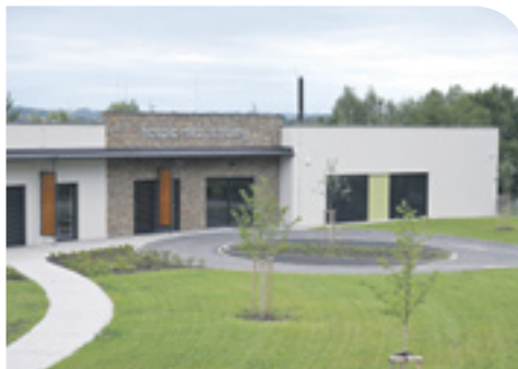
Hospic Mezi stromy