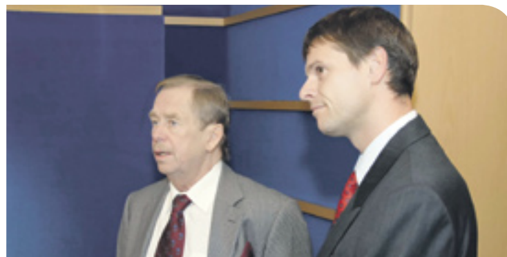
Pozvání na Letní žurnalistickou školu přijal také prezident Václav Havel.

Ve stejném roce přijela i Barbara Coudenhove-Kalergi, což je potomek rakousko-českého rodu, který po roce 1945 musel opustit Československo. Je to dáma, která stále i ve svých více než 90 letech mluví krásnou češtinou. Když jsem ji provázal po Brodě, tak mi řekla, že musím být velký patriot, což mě potěšilo, protože nejsem rodilý Broďák, ale žiji tady už hodně dlouho. Dneska jsou to vlastně už stovky hostů, které jsem Havlíčkovým Brodem provázal, a vždycky jsem se snažil, aby se tady cítili jako doma.