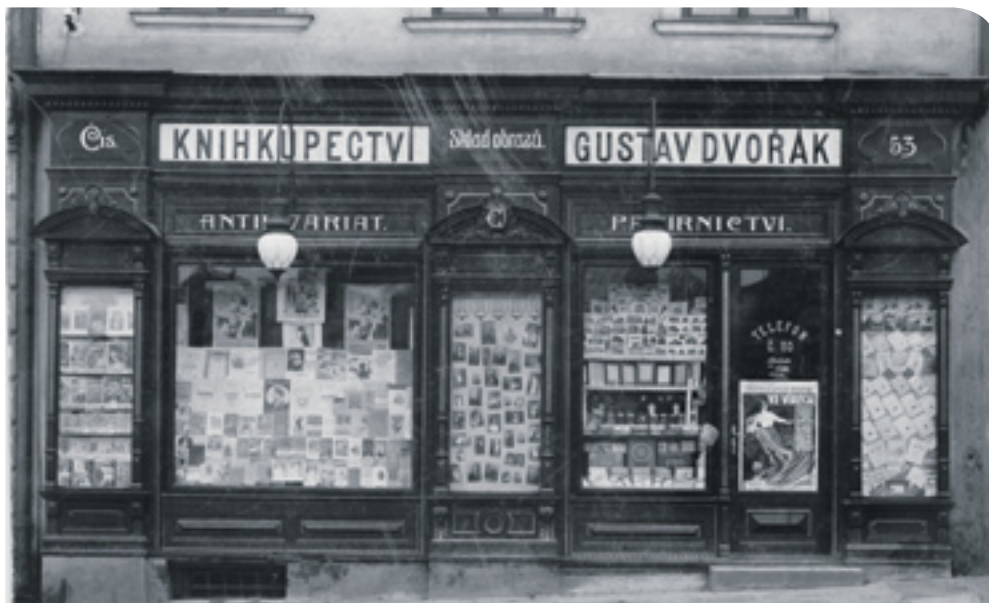
Knihkupectví Gustava Dvořáka