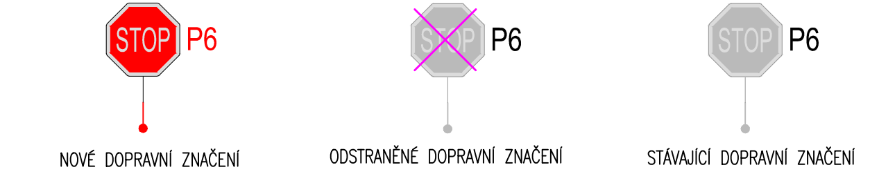
SCHÉMA UMÍSTĚNÍ DOPRAVNÍ ZNAČKY

– VODOROVNÉ DOPRAVNÍ ZNAČENÍ BUDE PROVEDENO NÁSTRÍKEM PLASTI!